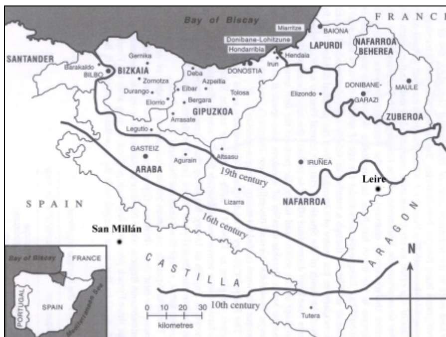
2. La regressione della lingua basca (TRASK 4).

Questo articolo si basa su documenti del nord cristiano della Penisola Iberica tra il IX e il XII secolo, cioè in un periodo molto anteriore al primo testo in basco risalente alla fine del XIV secolo (TRASK 45). Per l'ambito basco in particolare si considera una delle collezioni documentali centrali del regno di Navarra, quella del monastero di Leire.