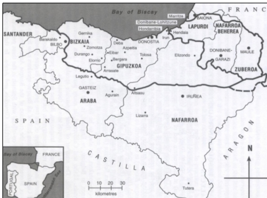
1. L'estensione della lingua basca (TRASK 2).